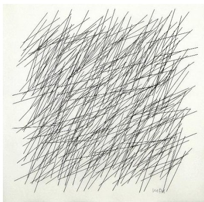
Segments et leurs croisements , 1971 dessin ordinateur au plotter, 36x30 cm

la galerie est ouverte du mardi au samedi de 14h00 à 19h00 + le matin sur demande