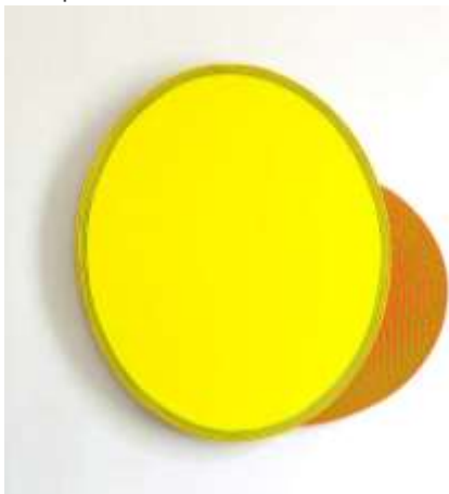
... Eclipse, ...2138 Etc... devant ...2058 Etc... acrylique sur toile • 2017

également le matin et le lundi pour les rendez-vous collectionneurs